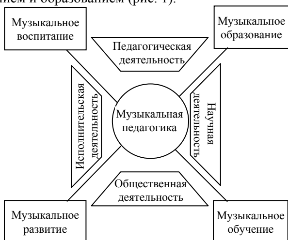
Рис. 1. Структура музыкальной педагогики

Музыкальная педагогика, благодаря постепенному накоплению опыта, его систематизации и обобщению, обрела свою теорию и встала на научную основу. Ее функции значительно расширились. На нее возложено не только обучение музыкальному исполнительскому искусству, но и воспитание, всестороннее развитие личности. Являясь частью общей педагогики, она связана с педагогической, исполнительской, научной и общественной деятельностью, переплетающейся с музыкальным воспитанием, развитием, обучением и образованием (рис. 1).