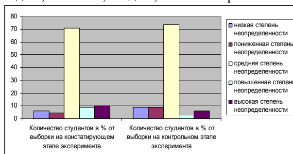
Рис. 1. Количество студентов в % от выборки с разными степенями неопределенности этнической идентичности на констатирующем и контрольном этапах эксперимента.

Приведенные на рисунке 1 данные показывают, что на контрольном этапе эксперимента по сравнению с констатирующим возросло количество студентов: 1) обладающих низкой степенью этнической неопределенности с 5,9% до 8,8% от выборки; 2) обладающих пониженной степенью – с 4,4% до 8,8%; 3) обладающих средней степенью – с 70,6% до 73,6%. Количество человек с повышенной и высокой степенью неопределенности, наоборот, снизилось соответственно с 8,8% до 2,9% и с 10,3% до 5,9% от выборки.